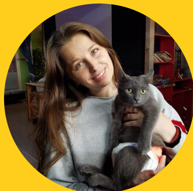
Ника (Ольга) Могилевская